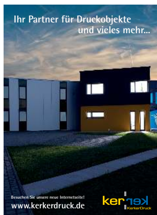
Ganze Seite 210x280 mm